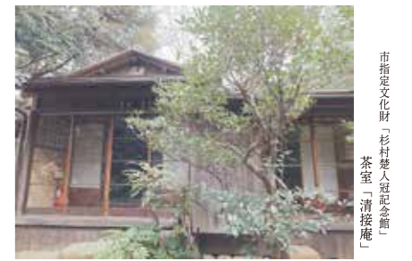
市指定文化財「杉村楚人冠記念館」茶室「清接庵」