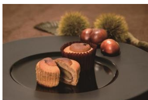
<柏>「ラトリエ モン、シェフ」 焼きモンブラン