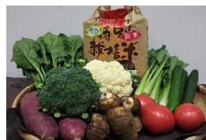
<我孫子> 特産のお米や野菜