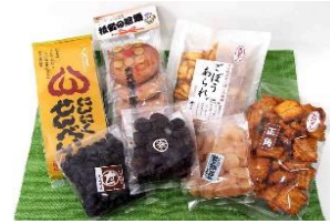
<取手> 地元メーカーの御菓子