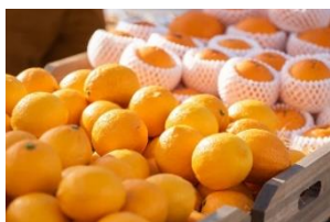
<松戸>「鶴殿シトラスファーム」 レモン