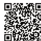
LINE 公式アカウント 「のもの産直市」

※プレゼントやショップカードの詳細についてはLINEアカウント内の注意事項をご確認ください。