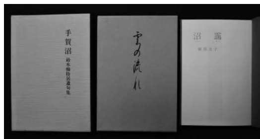
湖畔吟社会員の著作 鈴木梅陰居『手賀沼』 飯澤帰洛『雲の流れ』 新保旦子『沼霧』