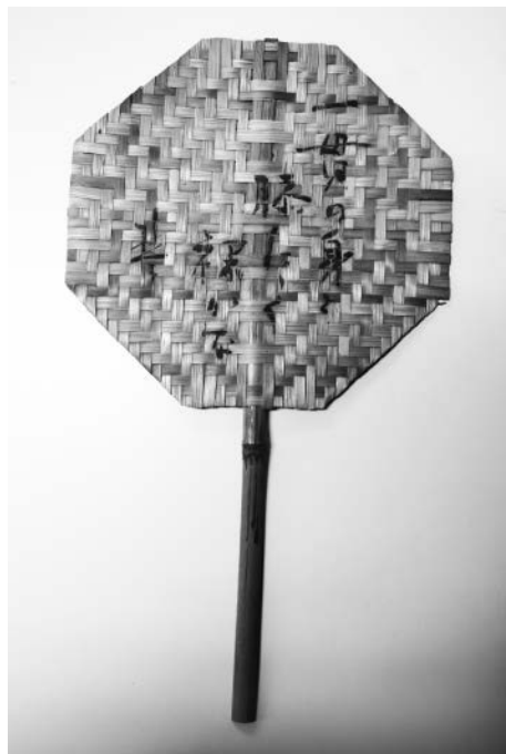
楚人冠書のうちわ 一貫の身と膝たたく裸かな