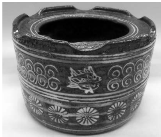
河村蜻山作 灰落とし