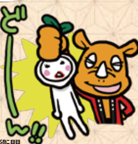
さかサイ君&カブ左衛門