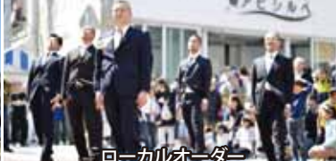
ローカルオーダー