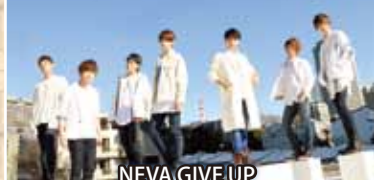
NEVA GIVE UP