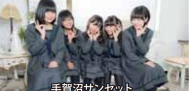
手賀沼サンセット