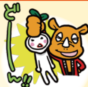
柏市逆井商店会マスコットキャラクター さがサイ君&カブ左衛門

さがサイ君: 座右の銘「ツノだつてあるさ サイだもん」 職業「マスコット業」 カブ左衛門: 日本一フットワークの軽い 野菜カブ(〜O〜)