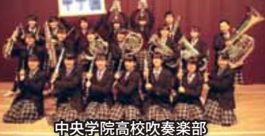
中央学院高校吹奏楽部