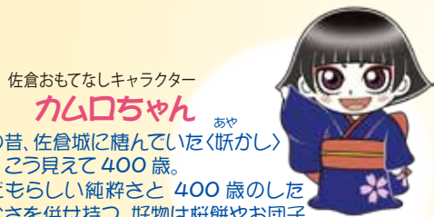
佐倉おもてなしキャラクター カム口ちゃん

好奇心旺盛でいろいろなことに挑戦するのが好き。食いしん坊でいたずら好きな面も。横から見た姿が千葉県の形をしています!