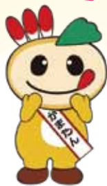
鎌ヶ谷市マスコットキャラクター

さがサイ君: 座右の銘「ツノだつてあるさ サイだもん」 職業「マスコット業」 カブ左衛門: 日本一フットワークの軽い 野菜カブ(〜O〜)