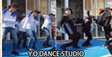
Y.O. DANCE STUDIO