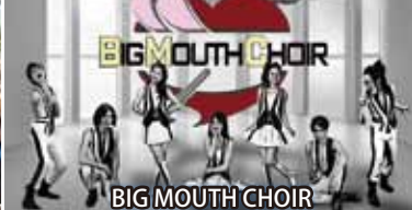
BIG MOUTH CHOIR