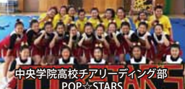
中央学院高校チアリーディング部 POP☆STARS