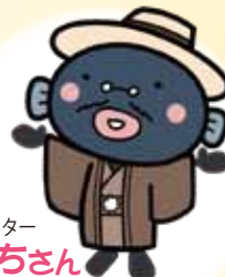
我孫子市マスコットキャラクター