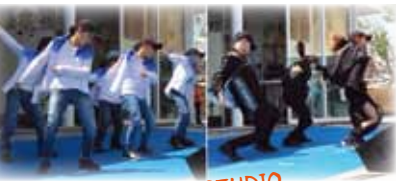
Y.O DANCE STUDIO