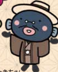
手賀沼のうなぎちゃん