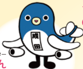
成田市観光キャラクター うなりくん

成田の役に立つ仕事をしようと思って市役所の窓口で相談したら、市長から成田の観光 PR をしてほしいと言われて「成田市特別観光大使」に任命されたの。ゆるキャラ®グランプリ2017で第1位になりました! うな。