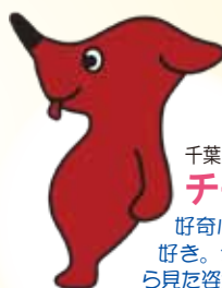
千葉県 PR マスコットキャラクター

「ほくは梨と野菜の妖精だ〜ん!」 出身地: 鎌ヶ谷の畑 年齢: はく歳 特技: むぎゅ〜う&ハブ