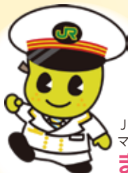
JR東日本松戸地区 マスコットキャラクター

その昔、佐倉城に糖んていたく(妖かし)で、こつ見えて400歳。 子どもらしい純粋さと400歳のしたたかさを併せ持つ。好物は桜餅やお団子。