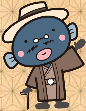
我孫子市マスコットキャラクター 手賀沼のうなぎちゃん