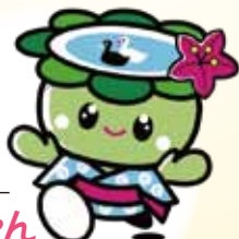
あびこカップまつり イメージキャラクター

名前の由来は、船戸市発祥の二十世紀梨から。駅長さんになりたくて、お母さんに駅長服を作ってもらいました。 苦手な物: 毛虫