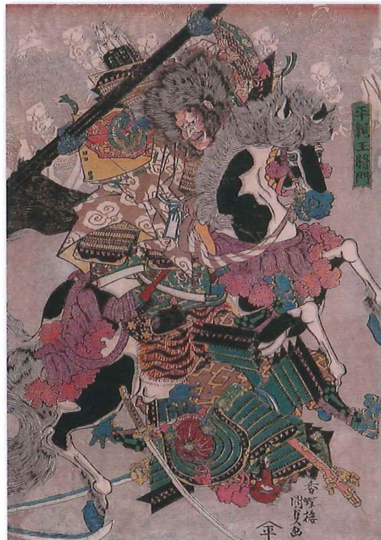
平親王将門 三代国貞・画