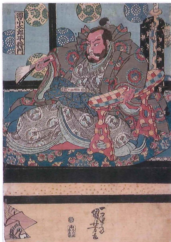
将門・公連の諫言を叱責す 歌川国芳・画