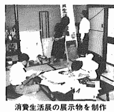
消費生活展の展示物を作成

本日、湖北中央公園で開催を予定していた第7回産業まつりは中止、同時開催の第13回消費生活展は次のおり延期になりました。催しの中止、延期で、来場を予定されていた方などにご迷惑をお掛けすることを深くお詫びします。 第13回消費生活展 「いただきます」その前に…をテーマに消費生活展では、衣食住の食にスポットをあて、最近の「食」物の安全性や問題点を取り上げます。 ▼日時 11月3日(祝)午前10時から午後6時 ▼会場 市民会館3階ホワイエ ▼問い合わせ 市民生活課