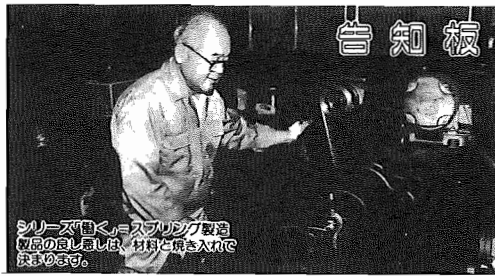
シリアスな「クマ」をデザインして、縫製された人形は、材料と柄をいれれば、完成する。

昭和63年10月1日現在 *人口117,633人(+2,451人) (対前年比) 男59,204人 女58,429人 *世帯数36,794世帯(+1,092世帯) ●市役所本庁 85-1111 ●つくし野支所 84-8801 ●湖北支所 88-0828 ●湖北支所 88-2111 ●市北支所 89-2358 ●教育委員会 85-1151 ●水道局 84-0111 ●消防署 84-0119 ●少年センター 84-1900 ●市史編さん室 85-2481 ●保健センター 87-1131 ●市民会館 84-3311 ●中央公民館 82-0515 ●市民図書館 84-1110 ●市民図書館湖北台分館 87-3055 ●市民図書館市北分館 89-1311 ●市民図書館移動図書館 87-0909 ●市民体育館 87-1155 ●都市改造事務所 85-1171 ●身体障害者福祉センター 88-0141 ●あらかき園 88-4188 ●つじ荘 88-0123 ●生活環境課(浄化槽) 87-2379 ●(ゴミ)87-0015 (し尿)88-2547 ●市北近隣センター 89-3740 ●天王台北近隣センター 82-9988 ●湖北支市民センター 88-9927