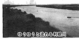
ゆめゆめと流れる利根川

利根川は、別名「坂東太郎」と 呼ばれ、その流れは群馬県から太 平洋へと注がれています。流域面 積は、日本最大。土質の上から眺 めると、この川は雄大な雄姿の ものです。堤防や河川では、日頃 ヨギンギや犬の散歩を楽しんでい る人を見かけます。