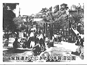
家族連れでにぎわう手賀沼公園