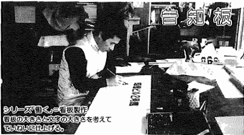
シリウス型電子看板製作 電灯の大きさと文字の大きさを考えて ていねいに仕上げる。