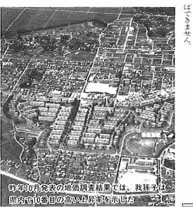
昨年10月発表の地価調査結果では、我孫子市は県内で10番目の高い上昇率を示した。