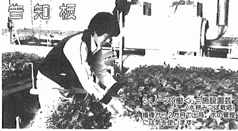
シリアスな顔で、三輪設置園芸(水耕栽培)圃場から2分車で出向、水の管理には気を配っています。

昭和63年1月1日現在 (対前年比) *人口115,733人(+2,210人) 男58,164人 女57,569人