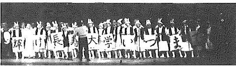
みんな素敵高年齢者 2月21日(日) 市民会館

成果を発表 長寿大学の各クラブ、各学年が一年間の成果を発表する楽しい祭りです。気軽にお越しください。 日時 2月21日(日)午前10時から午後3時30分まで 場所 市民会館(入場無料) 内容 *ホール 手鼓、クラシック、コーラス、民舞、社交ダンス 詩吟、民謡各学年の出しものなどを発表 *大会議室 水巻画、俳句、野外散策、ゲートボール、盆栽、手芸各学年の作品などを展示 主催 教育委員会長寿大学 問い合わせ 中央公民館 ☎0515