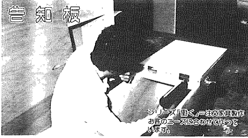
シニアズ・センター、社会教育委員会 おのろろ・アヒコで使われて います。

昭和61年10月1日現在 (対前年比) *人口113,239人(+1,363人) 男56,783人 女56,456人 *世帯数34,668世帯(+726世帯)