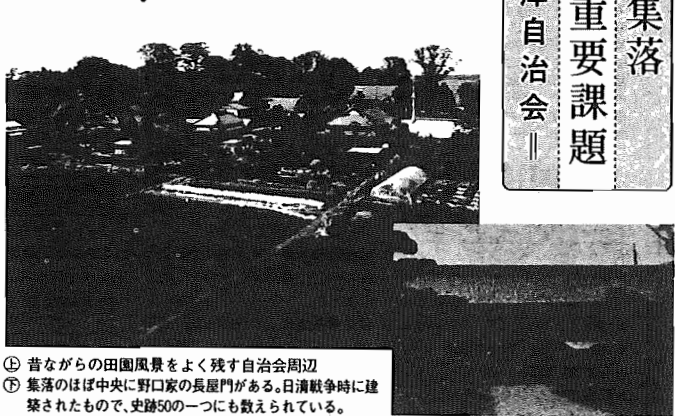
①昔ながらの田園風景をよく残す自治会周辺 ②集落のはば中央に野口家の長屋門がある。日清戦争時に建築されたもので、史跡50の一つにも数えられている。

昔ながらの農家集落から、みんなな素朴で人情が厚い。人間の昔の姿をみれば、わらわらと流れる阿比の川に接する。世帯数58世帯、純農村の風情が残る静かな集落である。 「同代にもわたるつきあいで気心は知れています。まとまるのは早いですよ」と話す。 自治会として一番の問題は道路の狭さ。自治会内の道路もより、久寺家の住宅地を抜けて集落に通じる畑の道も、ます車のすれ違いは無理。アクシーに断られたことも何度か。このままでは離れ小島みたいなものだ。一日も早く道路の拡幅と訴えている。