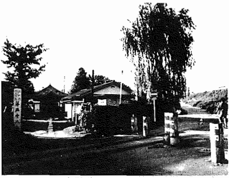
史跡50 網代場・生街道跡 当時、美味な布佐鮎は馬で松戸へ