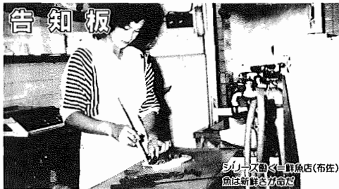
5リッパのくまの魚店(布佐) 魚は新鮮さが命

昭和60年6月1日現在 (対前年比) *人口 111,407人(+1,184人) 男55,817人 女55,590人 *世帯数 33,790世帯(+495世帯) ●市役所本庁 85-1111 ●つくし野支所 84-8801 ●湖北台支所 88-0828 ●湖北支所 88-2111 ●市佐支所 89-2358 ●教育委員会 85-1151 ●水道局 84-0111 ●消防署 84-0119 ●少年センター 84-1900 ●市史編さん室 85-2481 ●保健センター 87-1131 ●市民会館 84-3311 ●市民図書館 84-1110 ●市民図書館湖北台分館 87-3055 ●市民図書館移動図書館 87-0909 ●中央公民館 82-0515 ●都市改造事務所 85-1171 ●身体障害者福祉センター 88-0141 ●つつじ荘 88-0123 ●生活環境課(浄化槽) 87-2379 (ゴミ)87-0015 (し尿)88-2547