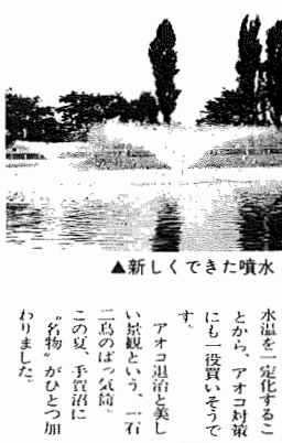
新しくできた噴水