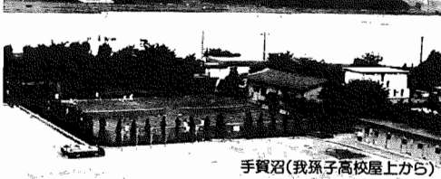
手賀沼(我孫子高校屋上から)

7月1日現在 (対前年比) *人口 108,775人(+3,504人) 男 54,509人 女 54,266人 *世帯数 32,707世帯(+1,562世帯) ●市役所本庁 85-1111 ●市民会館 84-3311 ●つくし野支所 84-8801 ●市民図書館 84-1110 ●湖北支所 88-0828 ●市民図書館湖北分館 87-3055 ●湖北支所 88-2111 ●つつし荘 88-0123 ●市佐支所 89-2358 ●都市改造事務所 85-1171 ●教育委員会 85-1151 ●中央公民館 82-0515 ●水道局 84-0111 ●身体障害者福祉センター 88-0141 ●消防署 84-0119 ●生活環境課(浄化槽) 87-2379 ●社会教育課 85-1511 (ゴミ)87-0015 (LJ)88-2547 ●市史編さん室 85-2481 ●保健センター 87-1131