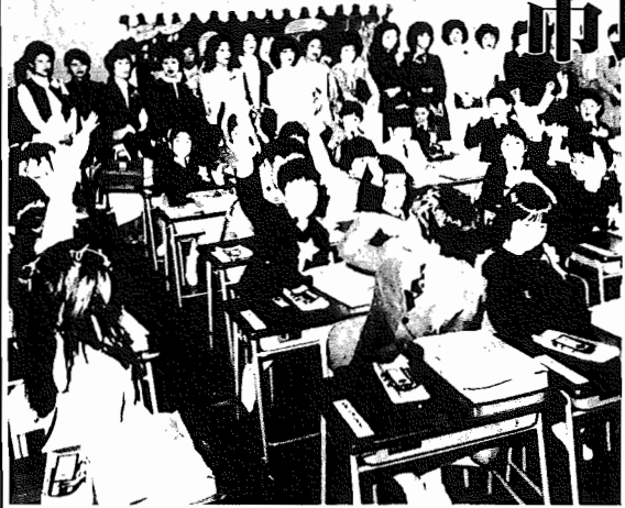
▲はくも今日から1年生=今年、開校した布佐南小、4月7日の入学式