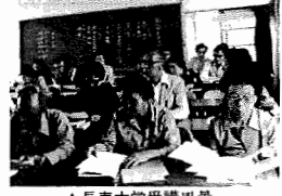
▲長寿大学受講風景

最近、ウエーブをつけたり染色したりして、おしゃれを楽しまる人がよく見かけるようになりました。パーマ液や染毛剤による皮膚障害が注目されるのも事実です。今回は、染毛剤やパーマ液について考えてみます。 ◎パーマ液によるかぶれ ◎染毛剤によるかぶれ 染毛剤のかぶれは、皮膚に接触した主成分が、一部皮膚内に吸収され、アレルギー反応を引き起こすことに特徴があります。アレルギー反応ですから、かぶれに気付くのは、染毛後数時間から数日経ってからが普通です。 一年間1回にわたり、くらしの危険を連続してくり返してしま