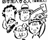
日本国内に住む20歳から59歳の人必ず加入する人(強制加入)

国民年金制度は、厚生年金保険や各種共済組合などの年金制度の対象とならない農林漁業、商業などの自営業、サービス業など人々とその家族の老後や不測の事故による死去、障害者に対する年金を支給し、生活の安定を図ることを目的とした制度です。