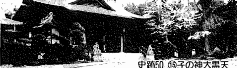
史跡50 王子の神大黒天

10月1日現在 ●人口 106,533人(+3,210人) (対前年比) 男 53,269人・女 53,264人 ●世帯数 31,524世帯(+1,170世帯) ●市役所本庁 85-1111 ●市史編さん室 85-2481 ●つくし野支所 84-8801 ●市民会館 84-3311 ●湖北台支所 88-0828 ●市民図書館 84-1110 ●湖北支所 88-2111 ●市民図書館湖北台分館 87-3055 ●市佐支所 89-2358 ●生活環境課(し尿・ゴミ) 87-0015 ●教育委員会 85-1151 ●つし荘 88-0123 ●水道局 84-0111 ●都市改造事務所 85-1171 ●消防署 84-0119 ●中央公民館 82-0515、85-0611 ●社会教育課 85-1511 ●身体障害者福祉センター 88-0141