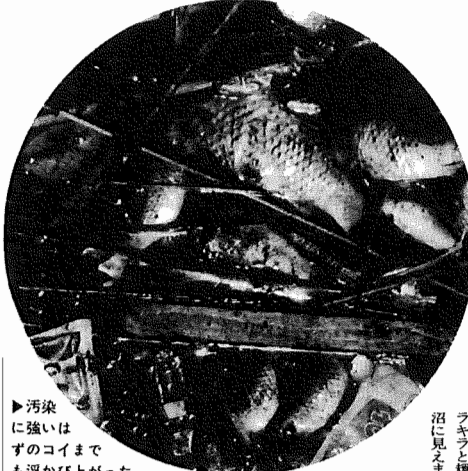
汚染は強い。ゴミまでも浮かび上がった。

手賀沼は、人と自然との長い歴史があります。開墾と利水、洪水と治水、漁業と生物相、さらには鳥りよや舟運の歴史に至るまで、いずれも手賀沼を代表する歴史でした。