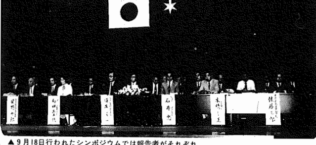
▲9月18日行われたシンポジウムでは報告者がそれぞれ浄化を訴えた。

富栄養化で「消化不良」に 今回のシンポジウムには、地元我孫子市をはじめとして、各市町村から参加者が詰めかけ、その数は七百人以上にも上り、「汚染防止」と形容れる手賀沼を、なんとしてよみがえらねえといふ声があふいた。 住民の強い願いがありありとくがえした。 二十年前、ウナギやワカサギがたぐさん獲れ、水底までも見えてきた手賀沼は、人口急増による家庭排水の大量流入で栄養過多となり、アオコの異常発生といふ「消化不良」を起こしてしま