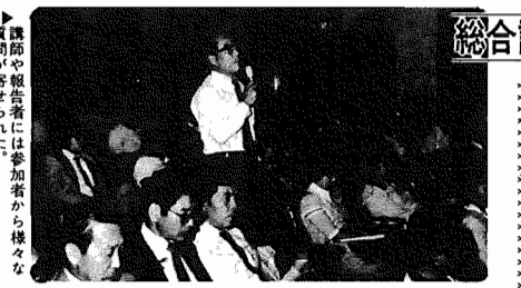
講師や報告者には参加者から様々な質問が寄せられた。