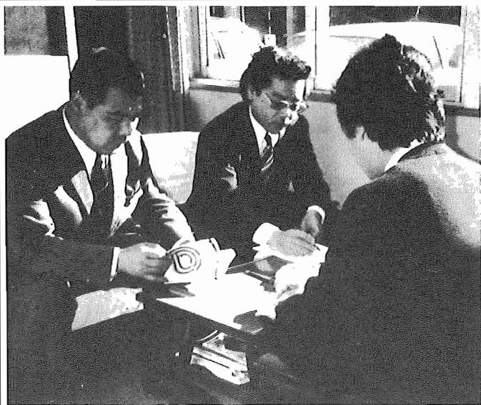
●いつでも気軽に相談にきてください。