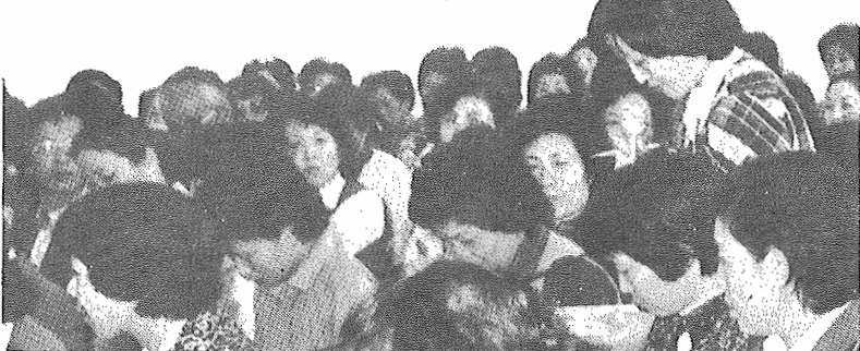
----- 昨年の市政懇談会 ----- つくし野コミュニティホールにて