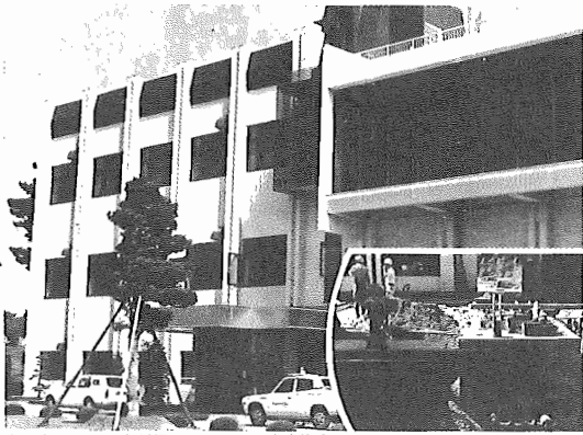
●受水のための工事が行われている久寺家浄水場

北千葉広域水道企業団からの受水のため、 久寺家浄水場では着々と工事が進められ、九 月二十日に通水式が行われます。 北千葉広域水道企業団からの受水問題につ きましては、市民のみなきさまに大変ご心配や ご迷惑をおかけしましたが、通水することに なりましたので、ご報告いたします。 今後とも、水道行政にご協力を賜ります ようお願い申し上げます。