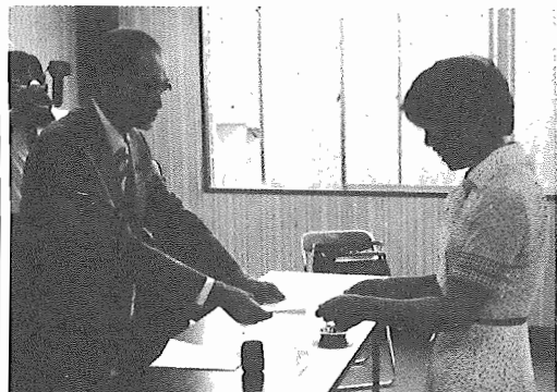
●市長に報告書を手渡す消費生活市民委員会の代表者

消費生活市民委員会は、昨年の七月に発足し、一年間の活動をすまてまいりました。このほど第一期の結果がまとまり、去る六月三十日、湖北市民センターで、報告書を添え市長に報告されました。この会は、消費生活行政の基本姿勢や当面重視の必要がある事項として、消費者の権利確立、消費者啓発と教育事業、調査と検査体制、過剰包装とゴミ問題及び合成洗剤などの問題を取り上げ一年間の検討を経験したものです。この報告書によると、行政に就いて大切なことは、被害が発生してから事後処理ではなく、予見予防的対応が必要である。消費者啓発、教育は、人間的開発、形成をめざすものであり、「安全な街あびこ」が多数を占めた時、消費生活が真に豊かになると報告して