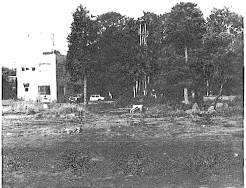
▲コミュニティセンター計画用地(旧湖北小学校)

昭和52年第3回我孫子市議会定例会が9月13日から29日まで開かれ、昭和52年度我孫子市一般会計補正予算、我孫子中学校分離校用地取得につき野第1保育園新築工事請負契約の締結など23議案が可決されました。