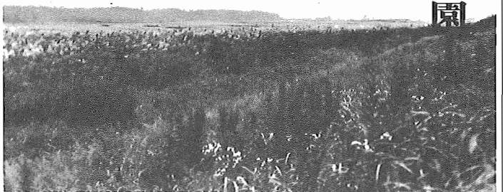
総合運動公園に予定されている河川敷

ポーツに参加するものむずかしい。センター、終端処理センターの反対側の河川敷203.4ヘクタールを利用するもので、運動施設を中心に、野球場、テニスコート、陸上競技場、パレコート、サッカー場などを組み合わせた総合運動場を利用し、河川敷をつくらうという計画が、昭和48年頃に生れました。 ところが、河川敷は、建設省の管理におかれ、むやみに利用することができません。そこで、河川敷の占用許可を受けるために、建設省にあらためて、都市緑地の決定を受けるために県と折衝して来た結果、この9月22日の千葉県都市計画地方審議会の承認もおり、いよいよ、国庫補助事業として、昭和53年を初年度とする5か年計画事業として着手することになりました。