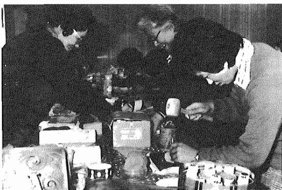
▲手作りの楽しさ。さて、できばえは。(手芸講座)