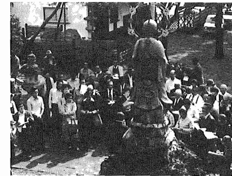
▲史蹟めぐりも真刻そのもの（正泉寺にて）