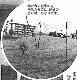
湖北台の園生の丘 子供たちには、絶好の 遊び場にもなります。