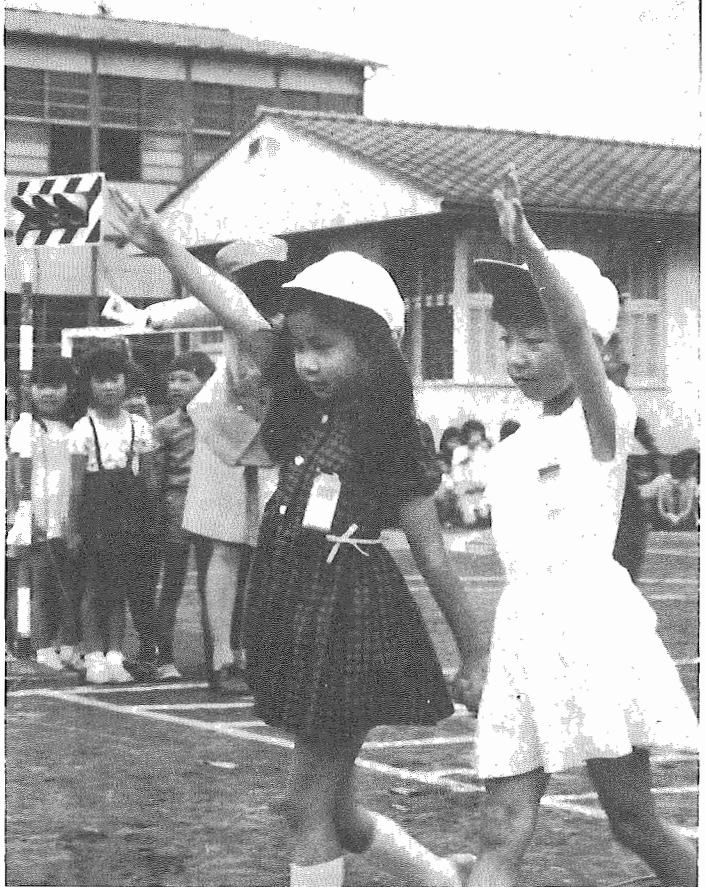
横断歩道は手を上げて・・・交通安全教室で習ったことを守りましょう

長かった夏休みが終り、今日から新学期です。 海や山へ行ったり、スポーツで鍛えた身体は真黒く日焼けしているのではないですか。 これから秋にむけて、勉強に運動に一年のうちで最も良い季節ですが、気をつけたいのが交通事故です。