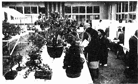
昨年の盆栽展示会場……中央公民館中庭