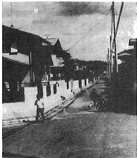
(上) 水と緑と太陽が豊富な私たちのまちあびこ (下) 日当たりもよく、整然と区画された住宅街

我孫子市の理想的な将来像をえがき、これを達成させるために、市は「我孫子市総合計画」を策定中です。 この計画は、昭和六十二年を目標年次として、います。 これによると、昭和六十二年には、人口十五万人、世帯数四万四千百世帯と推定されています。 都市の整備は、過密・乱開発を極力抑制し、自然と調和のとれた都市づくりをめざしております。 また、生産優先から人間優先への時代に即応し、自然を生かしたレジャー・スポーツ・文化活動を活性化して、快適な市民生活を実現させます。 福祉は、すべての市民が健康で文化的な生活を営むために、社会福祉を向上させ、特に恵まれない人々への救急に力を注ぎます。 教育は、複雑化していく社会情勢に対応できる人間形成を図るとともに、情操教育にも意をはらい、社会教育においては、生涯教育の一環として各種活動を活性化させます。 その他のすべての施策は、市民参加を基調とした「田園教育文化都市」の建設計画により行なわれていきます。