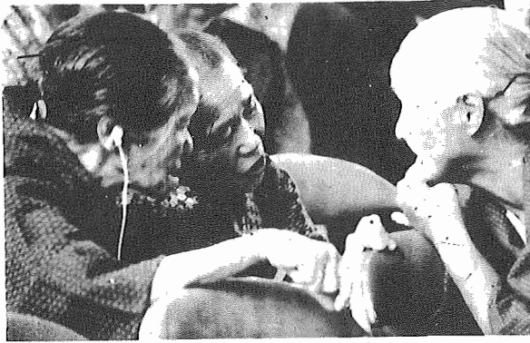
おばあちゃん！いつも元気だね

老人医療費の支給に関する条例の一部改正 六十五歳以上七十歳未満の方で身体上または精神上の障害があつて、日常生活を営むのに支障のある、いわゆるわたり老人等の方につき、十月一日から自己負担の医療費を市が負担し、無料にするものです。