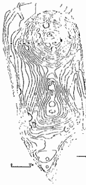
水神山古墳墳丘図