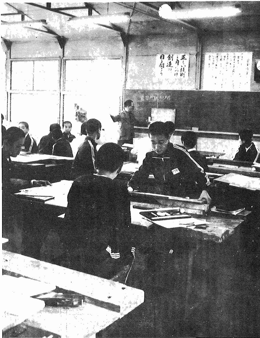
昼間も蛍光灯をつけて勉強にはげむ生徒たち（我孫子中で）