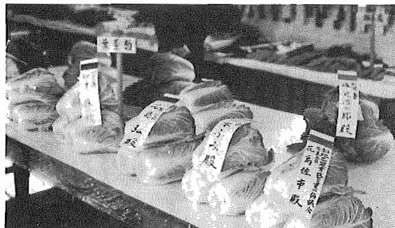
昨年の農業まつり展示風景