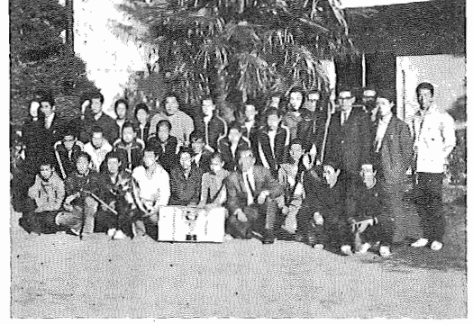
5年連続優勝を遂げた我孫子中チーム

各選手は、秋の日を喜び力走しましたが、我孫子中学校チームは終始主導権をとり他のチームを寄せつけず独走のかたになり、ました。 興味は二位争に移りましたが、総合力では終始湖北中学校チーム(昨年は八位)が昨年失格している浦安中の悲願を断つレース運びで堂々優勝に輝きました。 これら、良い成績を残したの豊富な練習とチームワークが良かったからだと思えます。 駅伝記録 一位 我孫子中(芦田多