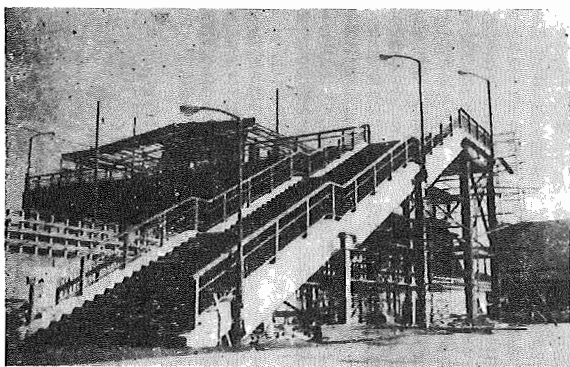
すでに自由通路が使用されている湖北駅（橋上駅となりました）

本年四月の日本住宅公団湖北台団地の入居開始に伴う国鉄成田線湖北駅の橋上駅新築工事は、この春から工事が進められておりましたが、いよいよ十二月二十日過ぎには完成の運びとなり、これにより、湖北駅は、これまでのいなかいローカル線駅から、めいばくを一新した近代的な駅に生まれ変わることにな