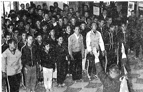
11月7日大会終了後市役所ホールにおける報告会

滞納整理強調月間 納税に協力 滞納整理強調月間は、日頃から協力をいただきありがとうございます。 皆様もご存知のとおり、市税は市予算の三分の一を占めています。滞納は教育、土木、衛生などいろいろな事業に使われず、ですから、税金の滞納が支障をきたし、住民の皆様にも不便をきたすので、役所へ来たいと思います。