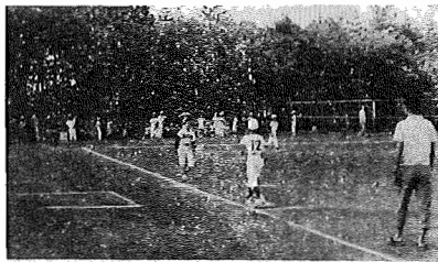
第3回少年野球大会 第3回少年野球大会は、8月18日、19日の2日間 にわたり湖北中学校グラウンドで行なわれました。肌を焦がすような炎天下で各チームとも好プレーの連続で試合が進められ、少年イーグルス（湖北小）が3年連続優勝しました。

最近青少年非行はふえてゐるかという質問に、ふえてゐると答へた者が全体の八十七パーセントを占めてゐる。これはマス・コミによつてをこのように感じよう。この質問を多く受けたことからは、実際に青少年の非行はふえてゐることを示唆している。交友関係が青少年の非行化に大きな影響を及ぼしてゐることは、以上の数字からいふまでもなく、明白である。