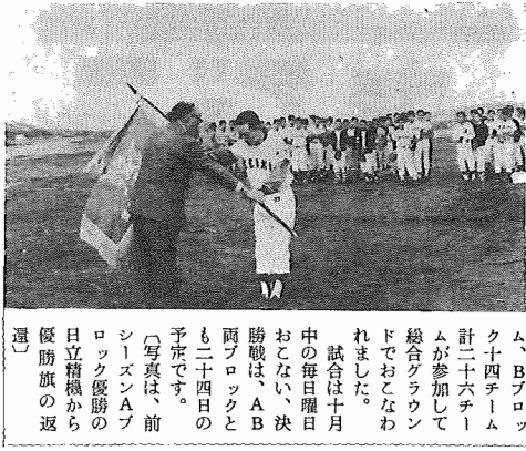
第六回町民野球大会の開会式は、十月三日午前九時から、Aブロック十二チーム、Bブロック十四チーム、計二十六チームが参加して総合グラウンドでおこなわれました。