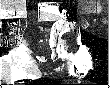
町医師会では1月下旬から2月上旬にかけて町内6ヶ所で血圧診断をおこないました。約100名の受診者中20名の要治療者を発見しました。〔写真は3小での診断〕

の許可はいろいろありますが、買取り、売買によって買受ければ、農地法の許可を受けなければその譲渡は無効です。 そして、小作地については、小作権が所有権と同等の権利を有するものと認められています。したがって、農地法の許可を得なければ、農地法上の所有権を行使することができません。 したがって、農地法の許可を受けて本家から所有権の移転を受けることとなります。