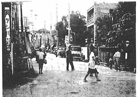
〔道路上では人も車も交通法規を守ろう〕

町内の小学校球技大会で布佐小学校がソフトボールとポルトボールの二種目に優勝しました。第二回の球技大会は九月十二日に第一小学校校庭で六校の代表選手と各校の応援団が集まりおこなわれました。男子のソフトボールは、布佐小と一小的決勝戦となりましたが六対五の接戦で布佐小が優勝しました。また女子のポルトボール(バスケットボールに似たもの)写真上は布佐小が二小を三対六で破り、これも優勝しました。