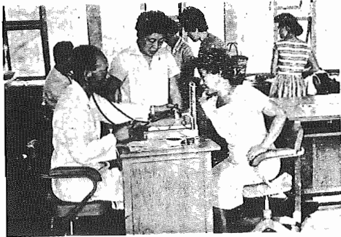
【だいたいよぶと思っても健康診断を受けましょう】

発行所 千葉県東葛飾郡我孫子町役場 電話(あびこ)42・142・242 昭和34年7月30日第三種郵便物認可 発行日 毎月 1日・16日