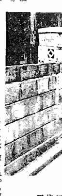
電柱にゴミ箱をとりつけて道路の美化運動