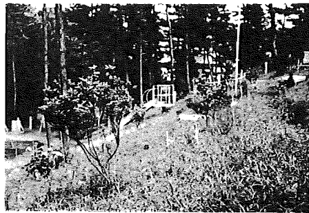
児童公園へつつじをおくる

尿浄化そうの機能は汚物の処理に相当の効果を持ってはいますが、反面その取り扱いをまちがうと、いへんなことになります。そこで設置する場合は届け出て ①腐敗そうには塩酸、硝酸、防臭剤等の消毒薬を移さないこと ②排水管、送気孔はふさがないように常に掃除する ③消毒薬そうは点検が可能であるようコックの流通をよく