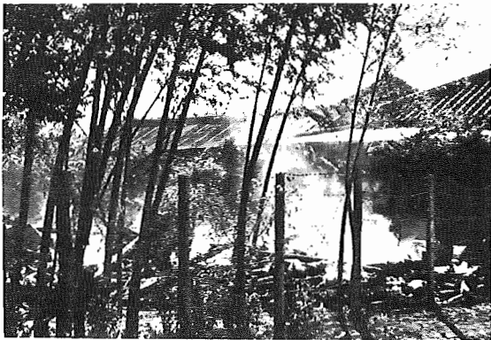
【ちよつとした不注意でこの火災】

徳川四天王の一人本多忠勝が、戰場からその妻に送った手紙に「一筆落し上りの用心、おせん泣かすな馬鹿せ」とあったことは有名な話であるが、留守中に火災などおぼろげなう考へ方は、いままも貴重すべきことである。