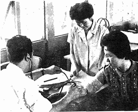
【私の血圧はどのくらいかしら】