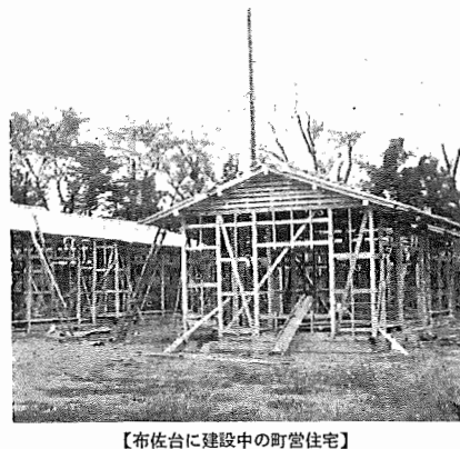
【布佐台に建設中の町営住宅】

布佐支所完成 9月18日に事務開始 長いあいだご不便をおかけしておりましたが、旧支所跡へ建設中の布佐支所は、りっしんと事務をとっております。 建設工事着々進む 入居予定は11月中旬 七月六日着工以来、着々工事を進めてきた本年度の公営住宅建設工事(第一種住宅三棟、第二種住宅三棟、布佐台)は、このほど上棟のはびととなり、十月下旬には上棟式を挙げる予定です。