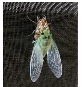
▲羽化したばかりのセミ