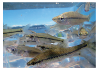
▲手賀沼で見られるモツゴなど