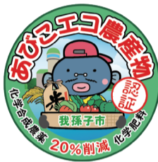
▲あびこエコ農産物 認証シール

申 ①第1回…9月30日(土)まで②第2回…10月1日(日)～令和6年2月29日(木)に、応募用紙(市内公共施設、あびこんで配布)を農政課に郵送・あびこの応募箱に投函 問 〒270-1146高野山新田193水の館内農政課 ☎04-7185-1481