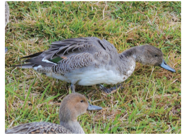
▲埼玉鴨場で標識放鳥されたオナガガモ

📺 視聴方法 鳥の博物館ホームページに掲載のリンクから動画サイトで配信(申込不要)