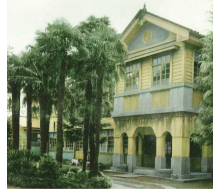
▲湖北小校舎(昭和45年)

長田校長 湖北小学校(以下、湖北小)は、正確な日付は残っていませんが、明治7年に中峠小学校として開校しました。当初は龍泉寺にありましたが、明治26年には現在の湖北地区公民館となっている辺りに木造校舎が建てられました。昭和49年に創立100周年を迎えた後、昭和52年5月25日に現在の校舎が完成し、この日を創立記念日としました。また、昭和19年に起きた手賀