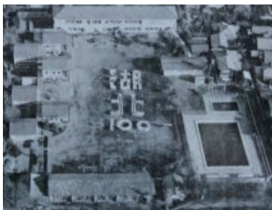
▲湖北小の創立100周年記念航空写真