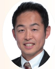
議長 甲斐 俊光

今年の干支はウサギです。ことわざの「ウサギの登り坂」のように、皆様が発揮する力により、幸多き素晴らしい年となりますよう、心からお祈り申し上げます。