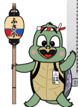
▲布佐小の新キャラクター「布佐かめ吉」

片岡さん 「夢のラッピングトレイン」では、さまざまなデザインがあり、とても楽しかったです。完成した絵は布佐駅に掲示しています。入賞作品はプラレールにして布佐小の昇降口に展示しています。新キャラクターは、昇降口の前にある池の亀をモチーフに、布佐小の伝統を取り入れたキャラクターを全児童が描き、児童会で編集して「布佐かめ吉」に決まりました。また、合言葉を全児童から募集し、「布佐っ子笑顔 いつも全力 元気なあいさつ」に決定しました。みんなが覚えられるように、ペラダに掲示しています。