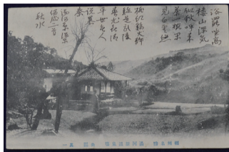
▲幸徳秋水絵はがき「近況短信及び漢詩2首」 明治43年4月18日

日時 令和5年1月9日(祝)まで午前9時～午後4時30分(入館4時まで) ※月曜休館(祝日の場合は翌平日) 内容 杉村楚人冠に送られた数々の手紙からみえる歴史を紹介いたします。当時の事件や戦争を人々はどのように感じていたのでしょうか。 入館料 300円(高校・大学生200円、中学生以下無料) 場所・図 杉村楚人冠記念館 ☎7187-1131