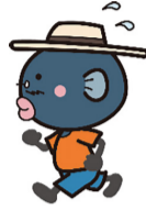
図 湖北・湖北台地区高齢者なんでも相談室 ☎7187-6777

日時 9月8日(土)午前11時30分スタート※荒天中止 ランナーはオレンジ色のTシャツにピンクのタスキをかけて走っています。見かけましたら、ご声援お願いします！