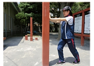
図 高齢者支援課 ☎7185-1112