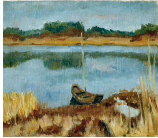
原田京平「手賀沼と小舟」(1921～1928年)▶

〈共通〉費用 無料(要入館料) 入館料 300円(高校・大学生200円、中学生以下無料)