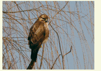
▲冬の農地で見られるノスリ

Abiko City Museum of Birds 鳥の博物館 234-3 Konoyama Abiko