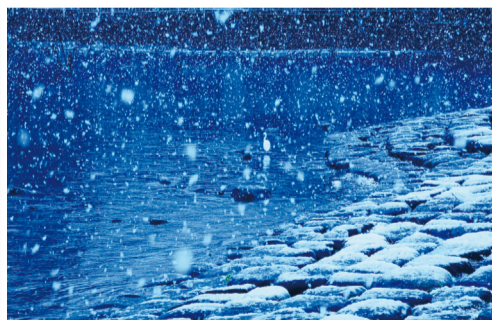
最優秀賞「吹雪く朝」