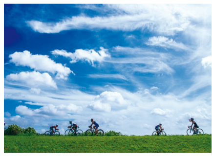
優秀賞「巻雲乱舞の空の下」