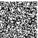
ちば電子申請サービス

対象 市内在住・在勤・在学の方 応募方法 6月9日(金)必着で、保健センター窓口・はがき・封書・ちば電子申請サービスで、標語1点・住所・氏名・年齢・性別・職業・電話番号を明記。 送付先 申・問 〒270-1132湖北台1の12の16健康づくり支援課(保健センター) ☎7185-1126