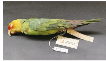
▲絶滅鳥カロライナインコの標本

場所 鳥の博物館2階多目的ホール 内容 カロライナインコは、北アメリカ大陸で絶滅した鳥類の代表としてたびたび紹介されます。山階鳥類研究所にはカロライナインコの標本が3点あり、うち1点は明治期に国立博物館が所蔵していた標本です。この標本の由来について近年の調査をもとにお話しします。