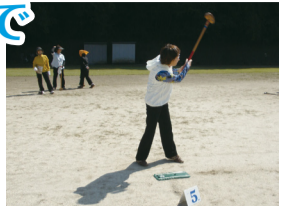
▲グラウンドゴルフ

こんな悩みをお持ちの方は、お近くのクラブへ足を運んでみませんか。初心者の方、ブランクのある方も大歓迎です! 詳しくは各クラブへお問い合わせください。