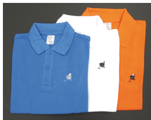
図 鳥の博物館 ☎7185-2212