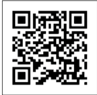
▲アプリのダウンロードはこちら

スマートフォンアプリ「i広報紙」で広報あびこの配信を開始 広報あびこをより多くの皆さんに手軽に読んでいただくため、4月1日号からスマートフォン用アプリ「i広報紙」での配信を開始しました。 主な機能 発行日にスマートフォンやタブレットの画面上に通知を表示、気になる記事を端末に保存、興味のある分野に関する情報をカテゴリページとして表示など ※アプリは無料（通信料は利用者負担） ☎ 秘書広報課広報室 7185-1269