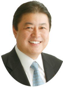
我孫子市長 星野 順一郎