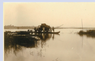
▲舟で車を運ぶ様子

みなさん、こんにちは。今回は、大利根橋付近を散策します。現在、青山から取手には橋を渡って簡単に行けますが、江戸時代は利根川を舟で渡っていたのをご存じですか。当時は青山と取手を通る水戸街道を結ぶために「渡し」が必要で、渡しは街道を通る人々にとって大切な交通手段であり、その運賃は地域の人々にとって収入源の一つでした。渡しは車が普及しても続きましたが、舟で車を渡すことは不便であったため地域住民から請願運動が起こりました。結局、国道6号が大利根橋によってつながったのは、昭和5(1930)年のことです。