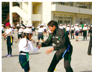
▲タグラグビー教室(我孫子第三小学校)

2019年には、ラグビーワールドカップが日本で開催されます。皆さんが田村選手をはじめラグビー日本代表、そしてNECグリーンロケッツを応援しましょう。今後、ますますの活躍を期待しています。 NECグリーンロケッツは、NEC我孫子事業場を拠点に、昭和60(1985)年に創部、今年で30年を迎えました。現在、田村選手を含む47人の選手が在籍しています。 ラグビー・タグラグビー教室の開催や、Enjoy手賀沼!などの市内のイベントに積極的に参加し、子ども達とのふれあいを通じて地域社会に貢献しています。